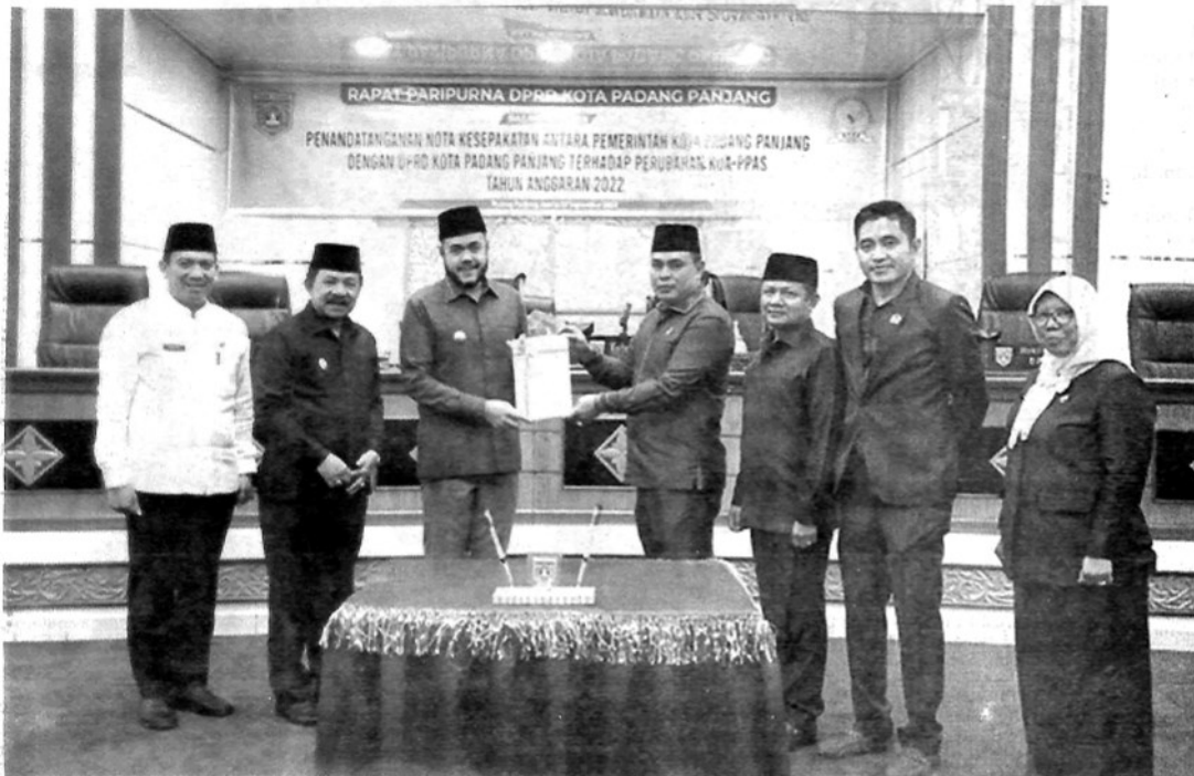
Penandatanganan Nota Kesepakatan terhadap Perubahan Kebijakan Umum Anggaran Prioritas Plafon Anggaran Sementara (KUA-PPAS) Tahun Anggaran 2022. APIZRAJALAM

PADANG PANJANG, HALUAN – Setelah melalui proses dan tahapan pembahasan, Pemko dan DPRD laku kan penandatanganan Nota Kesepakatan terhadap Perubahan Kebijakan Umum Anggaran Prioritas Plafon Anggaran Sementara (KUA-PPAS) Tahun Anggaran 2022.