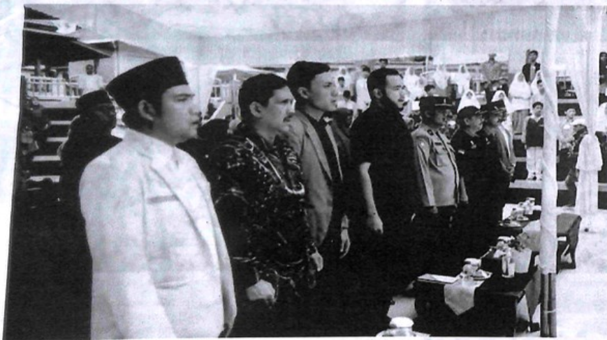
Pembukaan festival pemuda Serambi Mekkah.